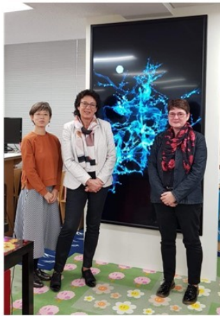
Nov 2018-Mission accompagner Florales de Nantes à Tokyo avec Team Lab