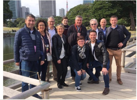
Nov 2018-Mission accompagnement avec la Région Pays de la loire « Mission France Japon » à Tokyo)