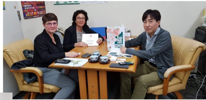
Nov 2018-Mission accompagnement Florales de Nantes à Tokyo avec Japan Flowers and Plants Export Association