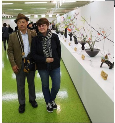
Oct 2018-Echanges avec Ecole Ikebano à Kyoto